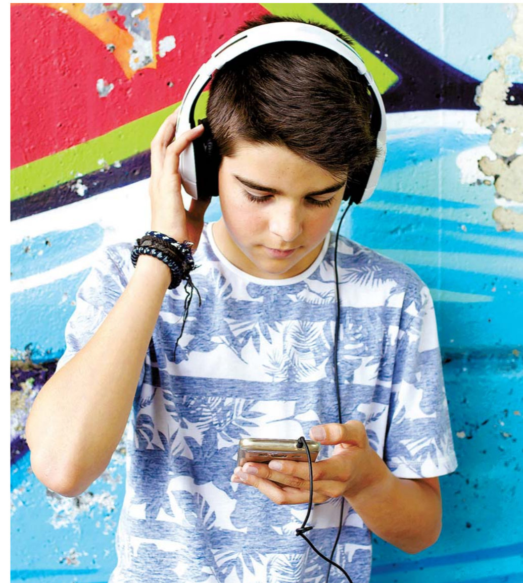
La música es otro de los campos que a los niños con TEAF les gusta y se les da bien.

psicoterapéutico. Además, el diagnóstico es "tan importante porque el primer tratamiento está en la comprensión. Entender que son así y que sus dificultades y todo lo que manifiestan no es por insolencia o porque no quieren, es porque no pueden", defiende Laguna. Hay niños, por ejemplo, que tienen la memoria a corto plazo muy afectada, y "yo entiendo que todas estas cosas pueden ser muy desesperantes para el maestro", especialmente si se desconoce que están provocadas por el TEAF.