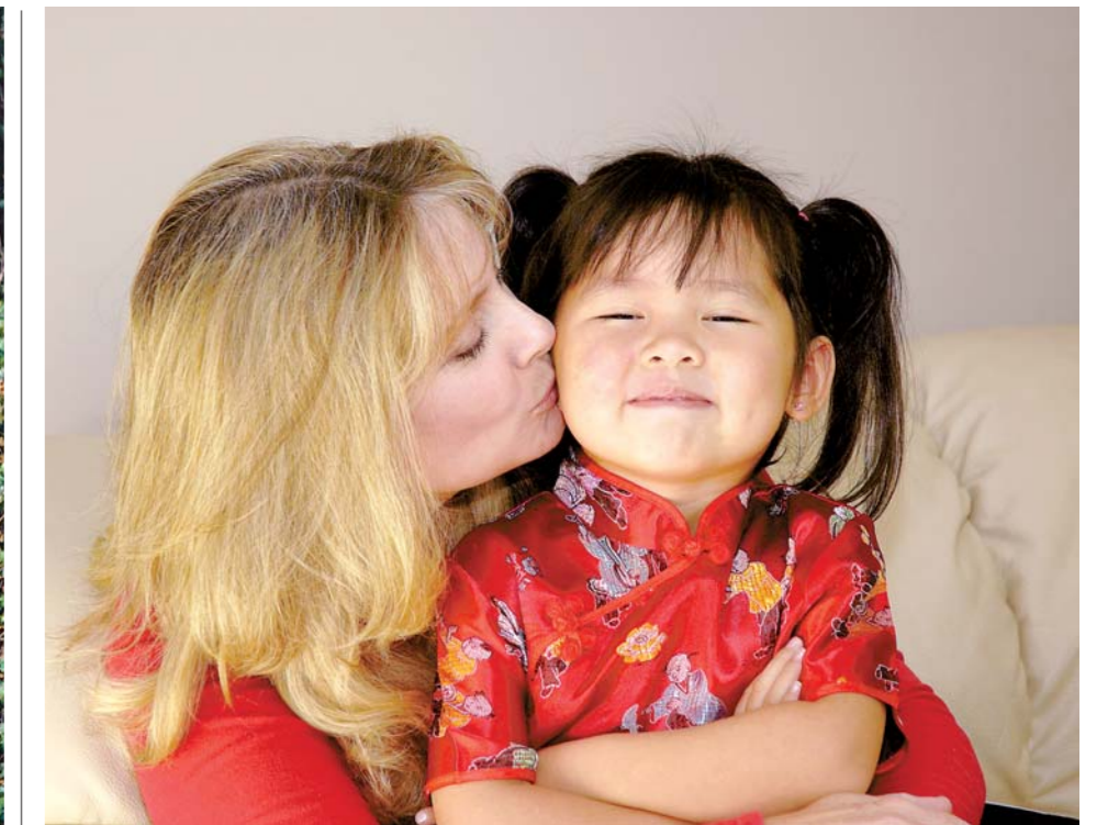
En ocasiones los niños son víctimas de discriminación por su raza.